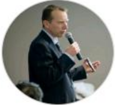
Animation Loïc TOURNEDOUE AFPA